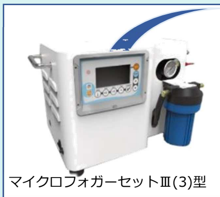
マイクロフォガーセットⅢ(3)型