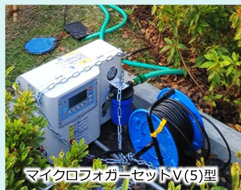
マイクロフォガーセットV(5)型

九州でも屈指の猛暑地域である日田市。 日田市の玄関であるJR日田駅で風鈴とミストによる暑熱対策として導入して頂きました。