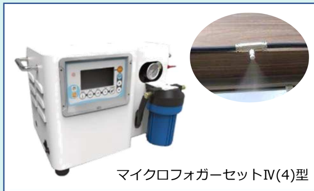
マイクロフォガーセットIV(4)型