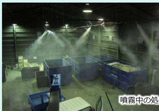
噴霧中の処分場内全景