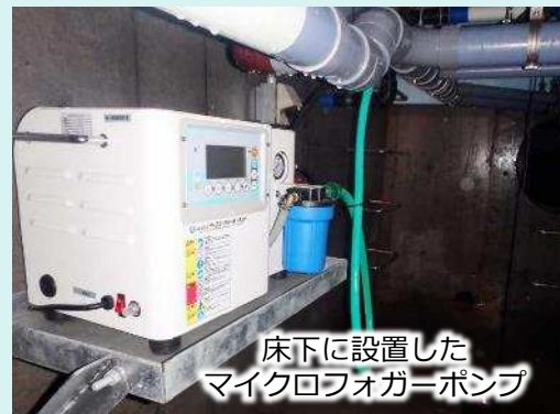
床下に設置した マイクロフォガーポンプ