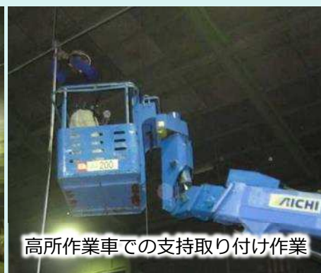
高所作業車での支持取り付け作業