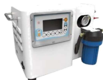
マイクロフォガーセットV(5)型