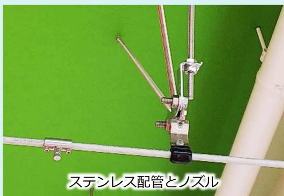
ステンレス配管とノズル