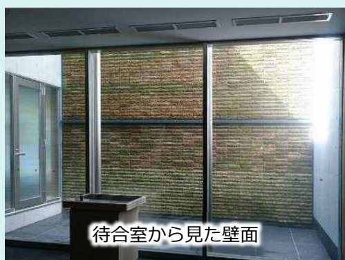
待合室から見た壁面