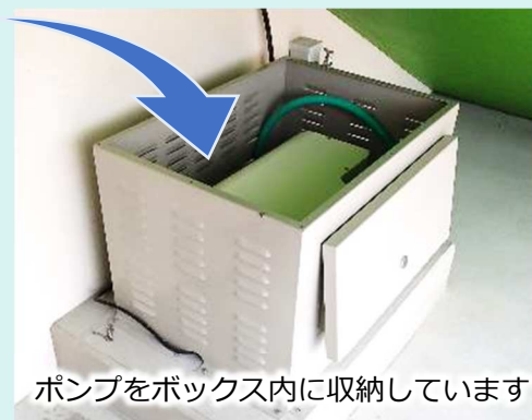
ポンプをボックス内に収納しています