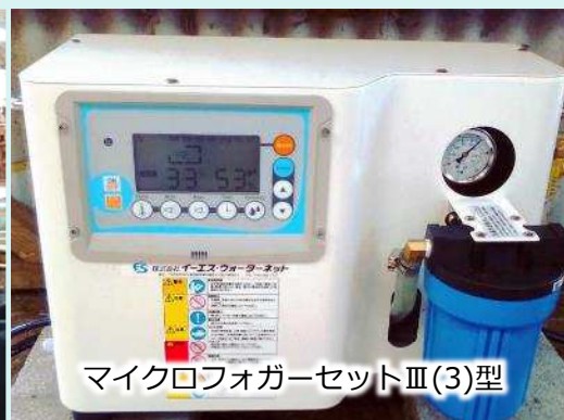
マイクロフォガーセットⅢ(3)型

乾燥しがちな冬場の加湿にも効果のあるマイクロフォガーを、牛舎に設置していただきました。