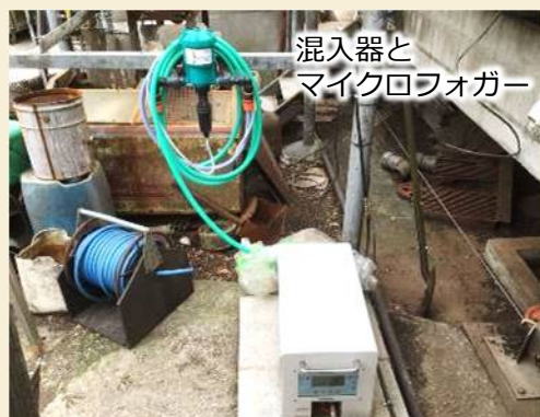
混入器と マイクロフォガー