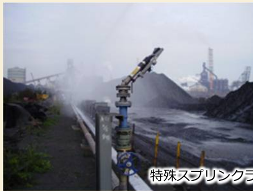
特殊スプリンクラー（ヤード用）SP-AP101