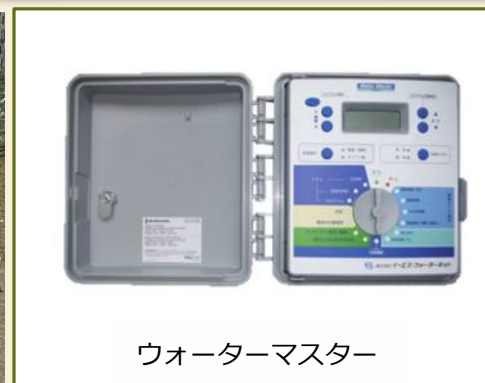
ウォーターマスター