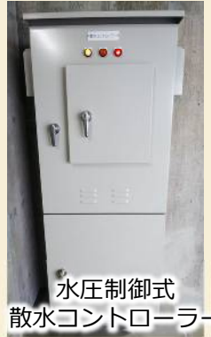
水圧制御式 散水コントローラー

ポップアップスプリングラーをパークゴルフ場の芝散水用として導入していただきました。