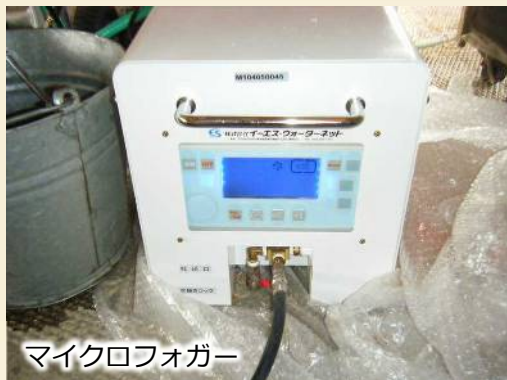
マイクロフォガー