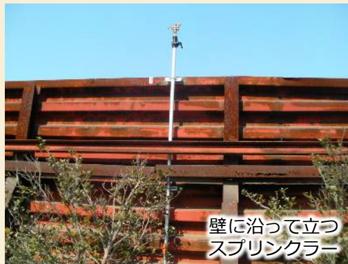
壁に沿って立つ スプリンクラー