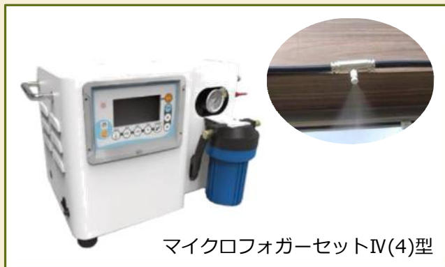
マイクロフォガーセットIV(4)型