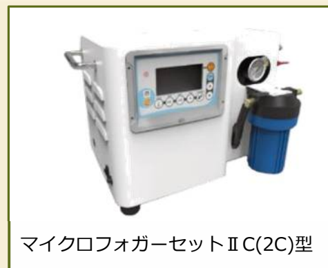
マイクロフォガーセットII C(2C)型