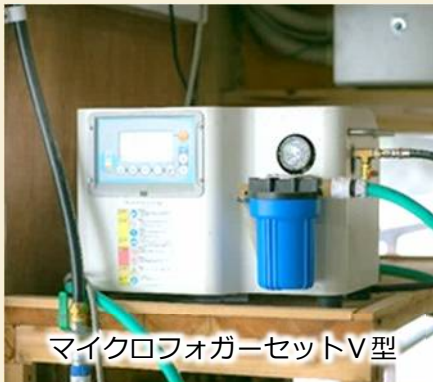
マイクロフォガーセットV型