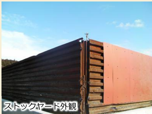
ストックヤード外観