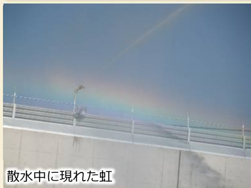
散水中に現れた虹