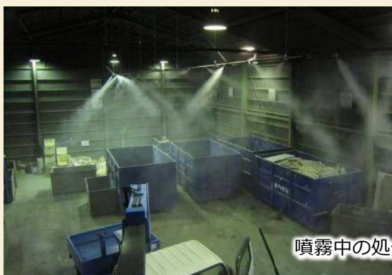
噴霧中の処分場内全景