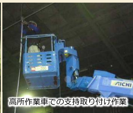
高所作業車での支持取り付け作業