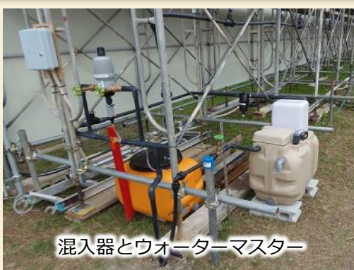
混入器とウォーターマスター